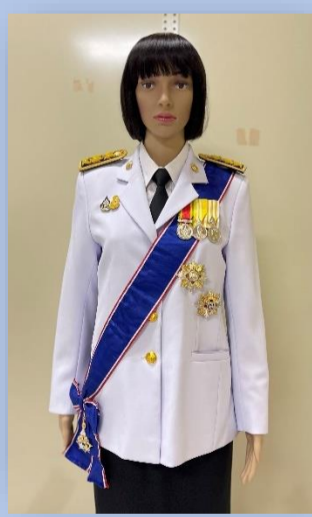
ตัวอย่างที่ ๔ ผู้ได้รับพระราชทาน ม.ป.ช. และ ม.ว.ม. (สวมสายสะพาย ม.ว.ม. และประดับดารา ม.ป.ช. ให้สูงกว่าดารา ม.ว.ม.)