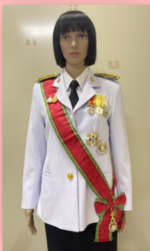
ตัวอย่างที่ ๒ ผู้ได้รับพระราชทาน ม.ว.ม. และ ป.ช. (สวมสายสะพาย ป.ช. และประดับดารา ม.ว.ม. ให้สูงกว่าดารา ป.ช.)