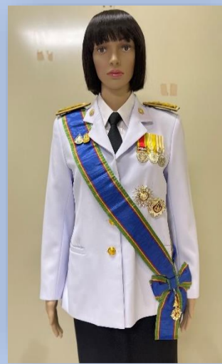
ตัวอย่างที่ ๕ ผู้ได้รับพระราชทาน ป.ช. และ ป.ม. (สวมสายสะพาย ป.ม. และประดับดารา ป.ช. ให้สูงกว่าดารา ป.ม.)