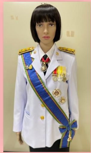
ตัวอย่างที่ ๓ ผู้ได้รับพระราชทาน ป.ม. และ ท.ช. (สวมสายสะพาย ป.ม. เนื่องจากเป็นชั้นสูงสุดที่ได้รับพระราชทาน หากไม่สวมสายสะพาย เท่ากับเป็นการแต่งกายครึ่งยศ ซึ่งไม่ถูกต้องตามหมายกำหนดการ)