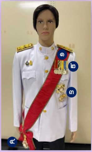
ผู้ได้รับพระราชทาน ม.ป.ช. และ ม.ว.ม.